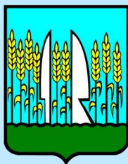
Budapest - Csepel